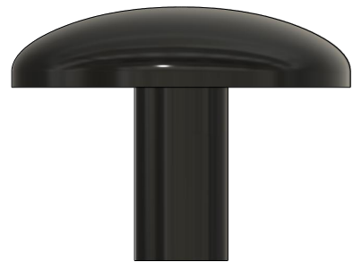
Schutzhaube Protective cover